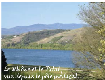
Le Rhône et le Pilat, vus depuis le pôle médical...

Le coût modéré des logements, la qualité paysagère de son environnement et son dynamisme, font de Saint-Alban-du-Rhône une commune où il fait bon vivre.